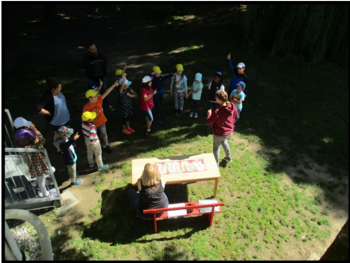
Wir spielen das Nummernsuch Spiel.