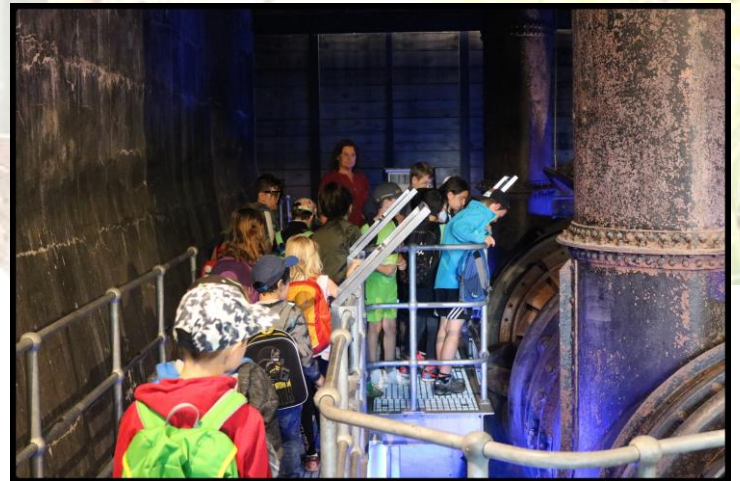
Ausflug zum Lechmuseum in Langweid.