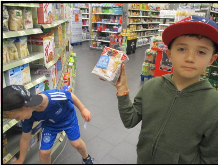
Hier waren wir einkaufen.