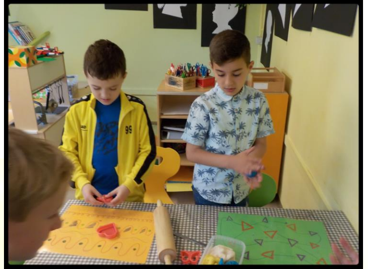
vatertagsgeschenke werden gebastelt.