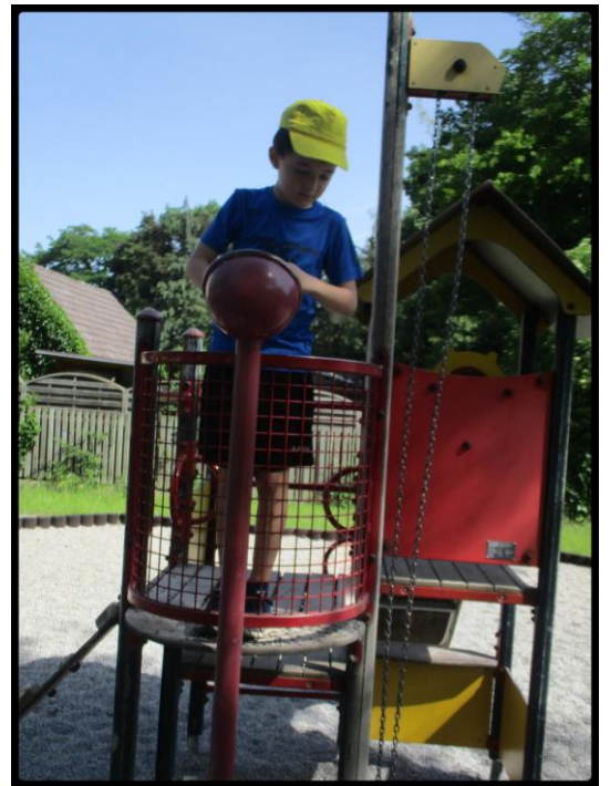
Ausflug zum Kolpingspielplatz.