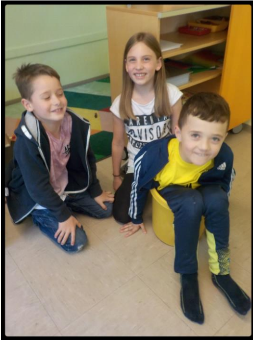
Hier steckt wohl jemand fest.