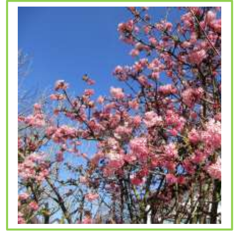
Die ersten Bäume blühen.