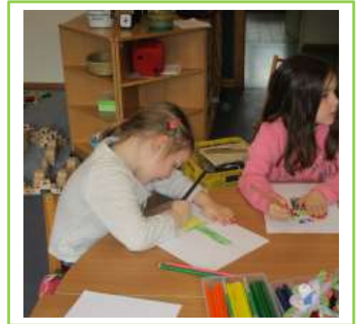
Zum Schluss malen wir unsere Blumen um sie später zu vergleichen.