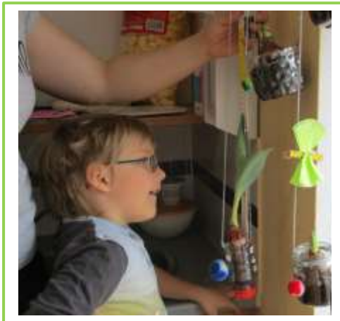
Auch die anderen werden gemessen.