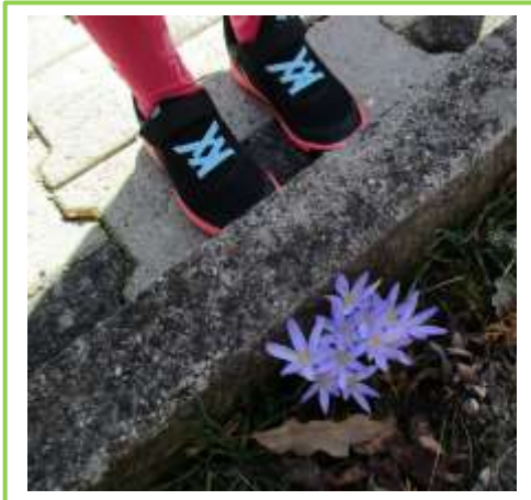
Wir finden Krokus