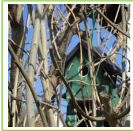
Die Blätter beginnen zu spießen.